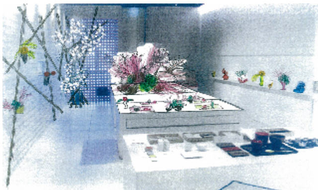
草月流のいけばなの真骨頂！ いけばなのインスタレーション。