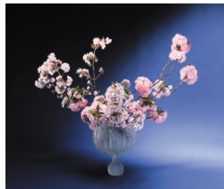
家元・勅使河原茜、桜のいけばな(小作) イメージ図

店外、店内、喫茶の展示スペースにいけばな作品など合計約11作品を展示する予定です。