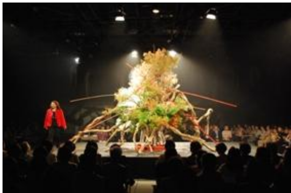
【舞台いっぱいに展開したアーティスティックな大作】

※草月流では、見ている人の目の前で制作過程を展開するいけばなを「いけばなデモンストレーション」と呼んでいます。