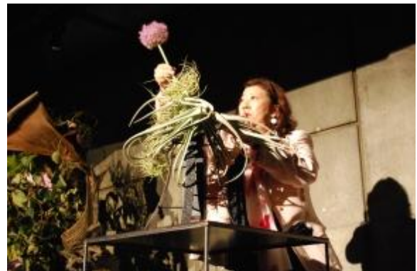
【舞台上で小作をいける家元・勅使河原茜】