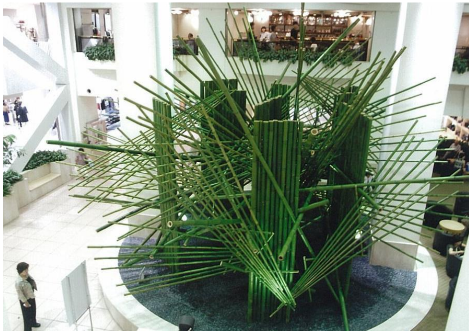
勅使河原茜作品（2007年9月 玉川高島屋S・C） 竹の直線と緑の色が力強い存在感を出した。