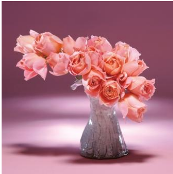
勅使河原茜 作品(自作陶器花器に國枝啓司育種の和ばら「茜」)