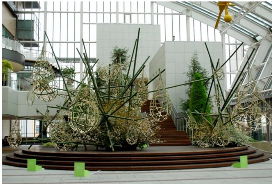
勅使河原茜作品（2010年3月博多パレインイニミニマニモ） 約6mの丸竹で骨格を組み、しずく型に編んだ割竹をリズムカルに配した。