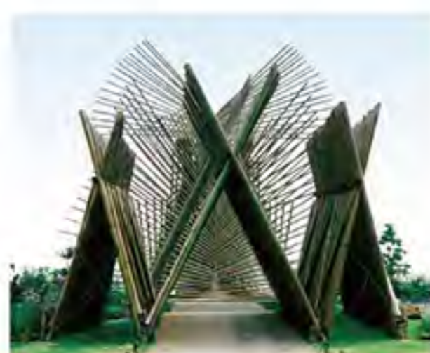
※作品はイメージです。