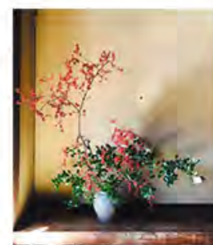
※作品はイメージです。