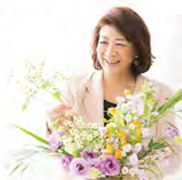
草月流第四代家元・勅使河原茜