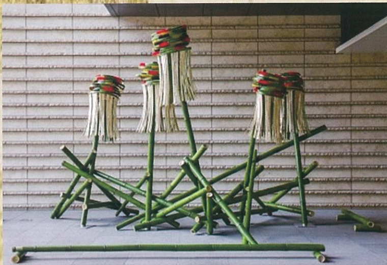
紀尾井町テラス 1F エントランス前回作品