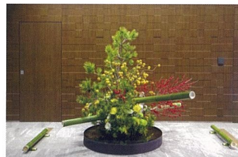
「Welcome-紀尾井町へようこそ!-」 3F 特設展示場所