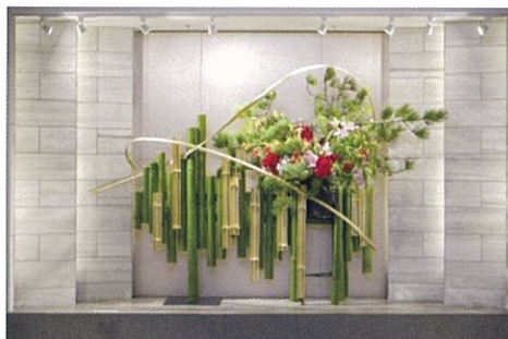
「Active-今年は沢山出かけよう!-」 2F ウォールギャラリー