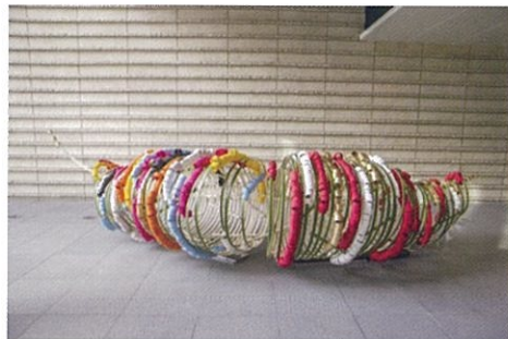
「Reunion-やっと会えた!-」 1F ホテルエントランス