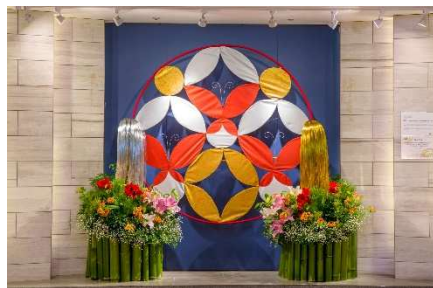
「羽ばたき Spread my wings」 2F ウォールギャラリー