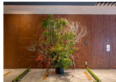
「あけぼの」 3F 特別展示場所