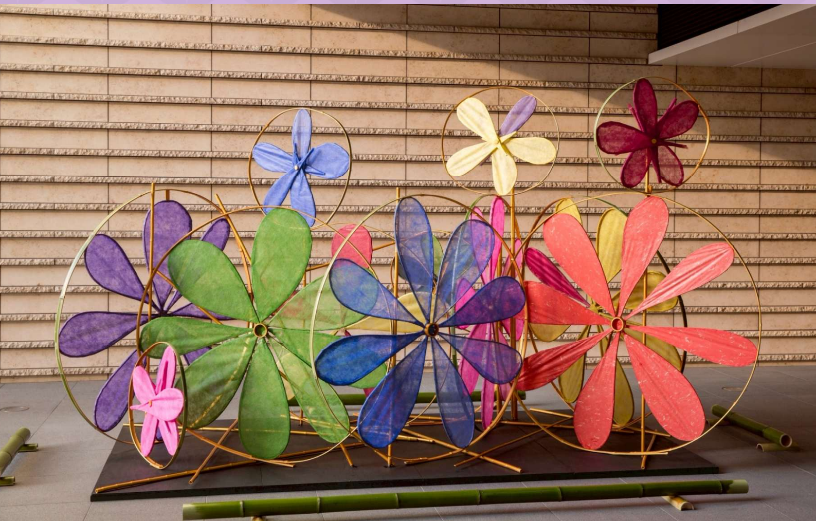
1F ホテルエントランス前回作品