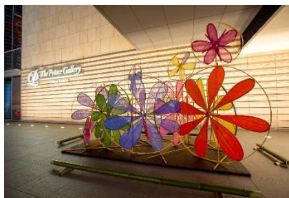
「受け継がれる文様」 1F ホテルエントランス